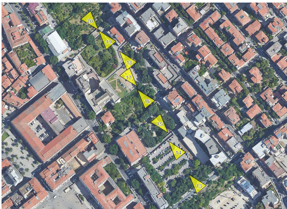
Figura D - Individuazione dei punti di scatto su ortofoto