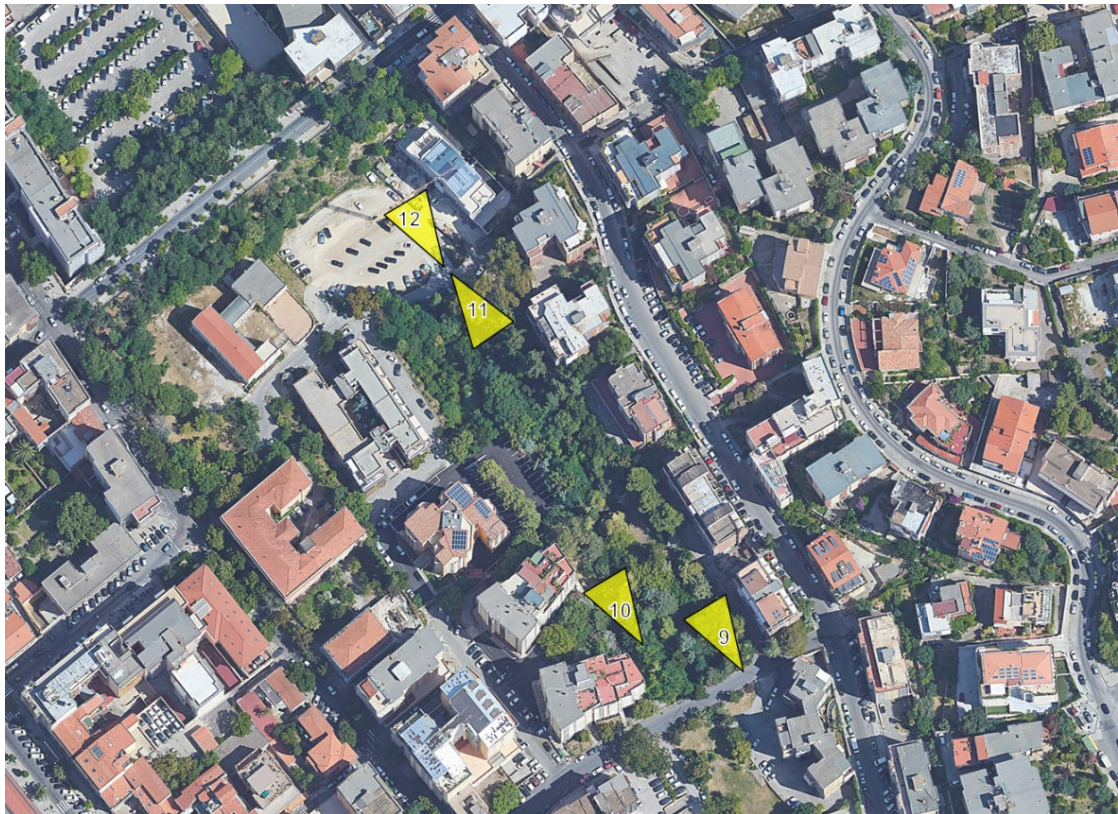
Figura C - Individuazione dei punti di scatto su ortofoto