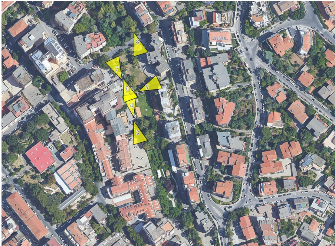
Figura B - Individuazione dei punti di scatto su ortofoto